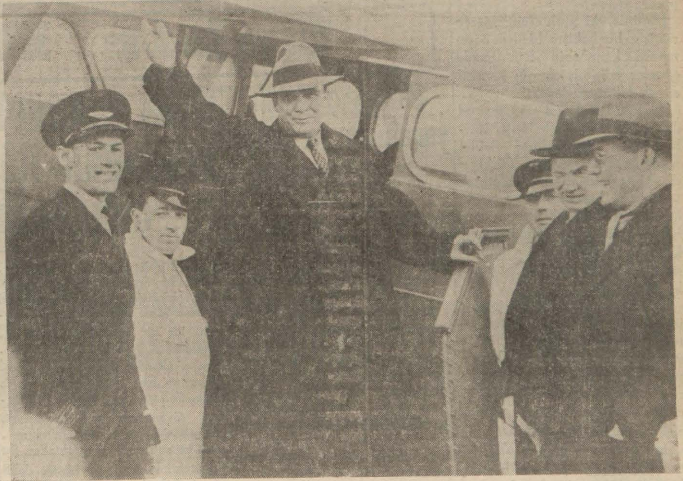
Wilkie tayyare seyanatlerinden birinde karaya ayak basarken

Amerikanın ikinci mühim ve meşhur siması: "Amerikalılar harbi kazanacaklarından emindirler!,, diyor Sureti mahsusada Ankaraya giden arkadaşımız bi'diriyor