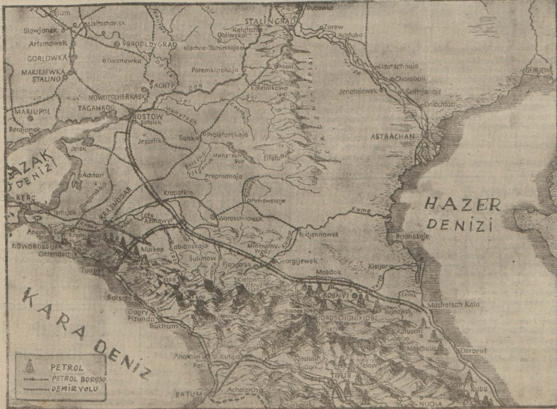
Şark cephesinin cenub kısmını bütün tafsilâtile gösterir kabartma bir harite

Gece Umumi Müfettiş tarafından dan şereflere bir ziyafet verilmiştir. Başvekilimiz yarın Başkaleye hareket edeceklerdir. Münakalât Vekili Malatyada Malatya, 7 (A.A.) — Münakalât Vekili Amiral Fahri Engin, dün şehrimize gelmiş ve başta vali olmak üzere, vilâyet ve Parti erkânı tarafından karşılanmıştır. Münakalât Vekili, resmi ziyaretlerden sonra bez fabrikası ile demiryolları işletmeye tesislerini (Devamı 5 inci sayfa)