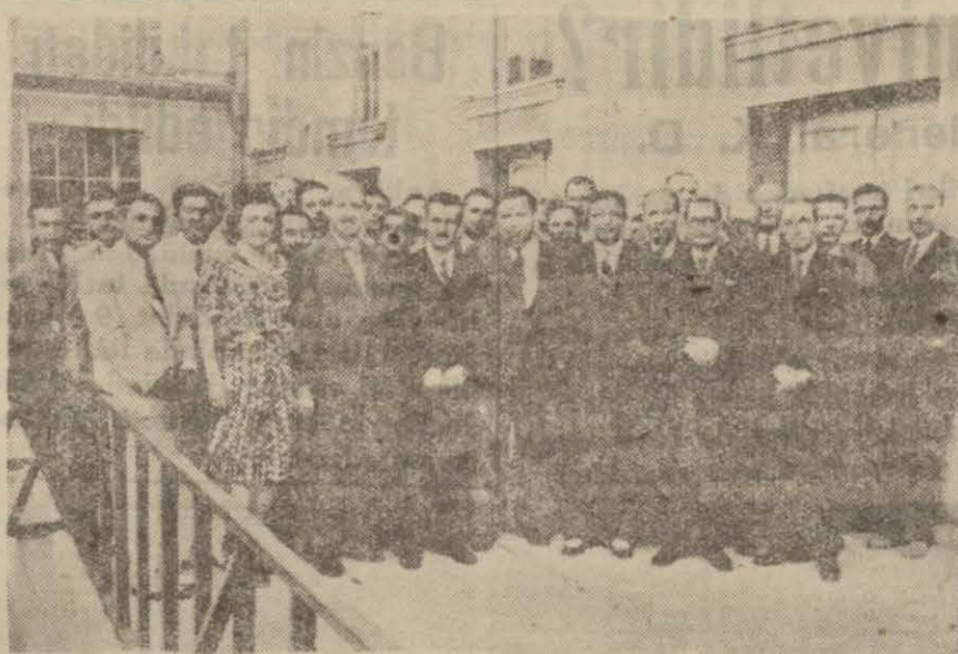
Eminönün Halkevindeki toplantıda bulunanlar